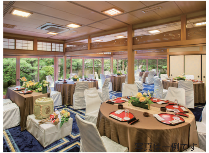
光あふれ、ゲストとの距離が近いと好評の会場