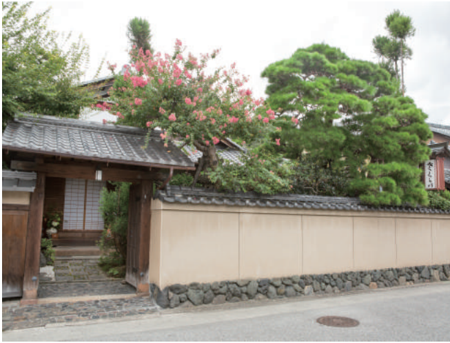
社家町に佇む「京料理さくらい」会場外観